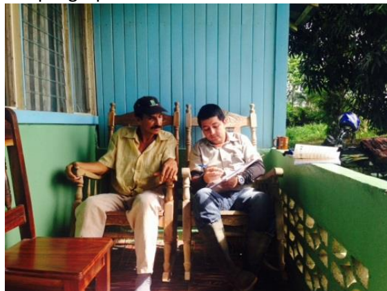
Figura 1: Extensionista de Coopeagropal R.L. impartiendo información de Buenas Prácticas Agrícolas.

A finales de 2015, el Trabajo de Extensionismo logró asegurar el cumplimiento de las normas agrícolas en 2285ha, correspondiente 133 productores. Esto equivale aproximadamente a 11% de la producción de fruta fresca procesada por Coopeagropal R.L.