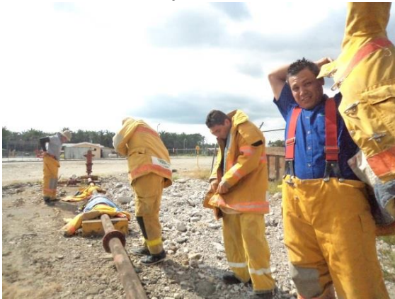
Figura 6: Procesos de formación para brigadistas y colaboradores de centros de trabajo agrícolas e industria.

Como medida del desempeño general de la Gestión Preventiva en la Empresa, el Índice de Desarrollo Preventivo pasó de un 30.2 a un 77 en 2015. Este avance es el resultado de una cultura por la mejora continua y la convicción del aporte de cada individuo a la construcción de Centros de Trabajo Saludables.