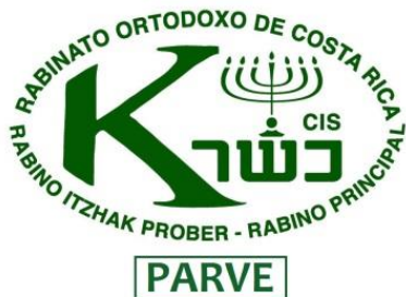
Figura 7: Logo costarricense de la certificación Kosher.

Durante este año se gestionó la certificación de nuestros productos bajo el sello Kosher, una distinción que nos permite colocar nuestros productos en mercados exclusivos a nivel nacional e internacional que solicitan dicha certificación para el consumo de alimentos.