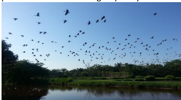
Figura 2: Sistema de Tratamiento de Aguas de Coopeagropal R.L.

Todas las aguas residuales de la Cooperativa son tratadas adecuadamente según lo exigido por la legislación. Por ejemplo, las aguas vertidas por el Sistema de Tratamiento de Aguas de la Planta El Roble siempre estuvieron por debajo de los parámetros de vertido exigido por ley 1 .