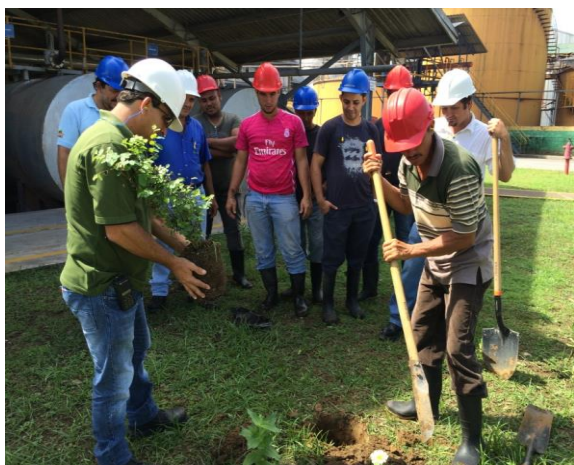
Figura 4: Colaboradores de Coopeagropal R.L. participación en la actividad de “Siembra de Árboles”.