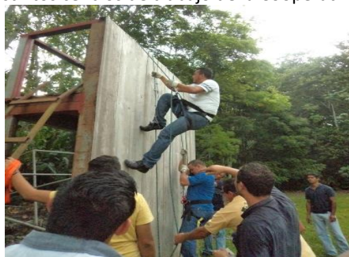
Figura 5: Entrenamiento a los Brigadistas de la Cooperativa.

El autocuidado y la prevención de riesgos laborales, se construye en el quehacer diario de Coopeagropal R.L. Por lo que, desde hace dos años se vienen realizando esfuerzos para mejorar las condiciones laborales de los distintos centros de trabajo de la Cooperativa.